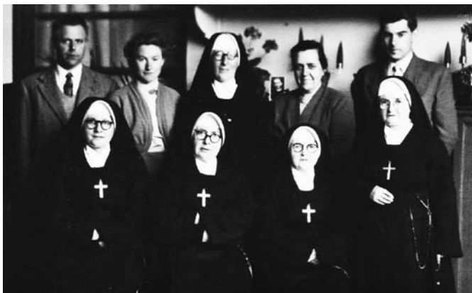
Het onderwijzend personeel van de meisjes- en jongensschool van Durmen in de jaren vijftig.