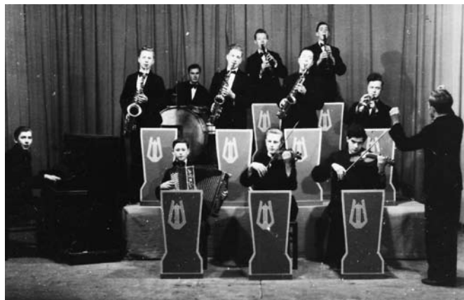
Het orkest van de KSA, kort na de bevrijding